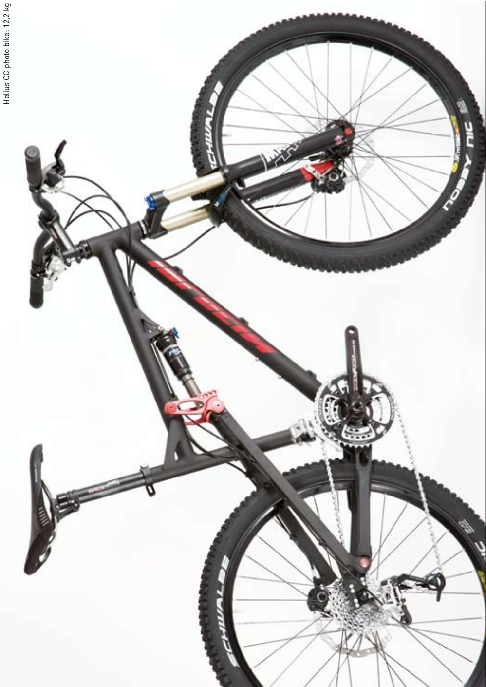
Komplettad HELIUS CC