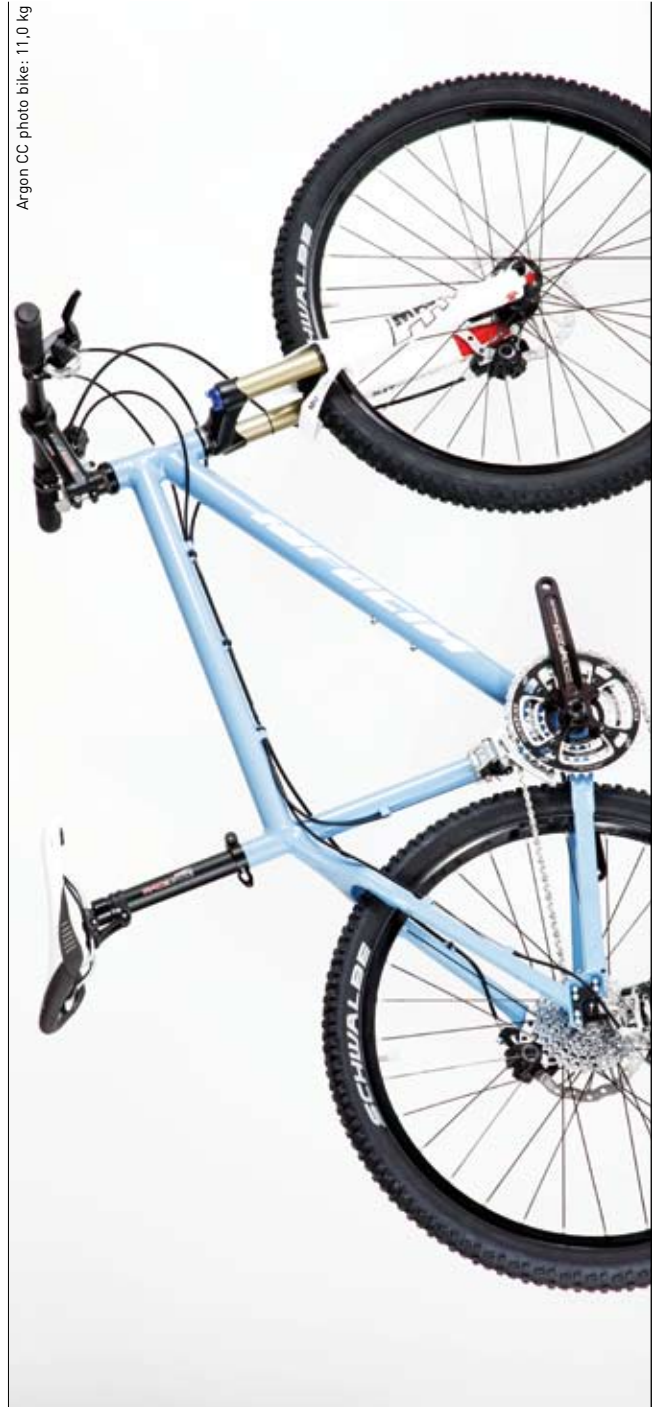
Argon CC photo bike: 11,0 kg