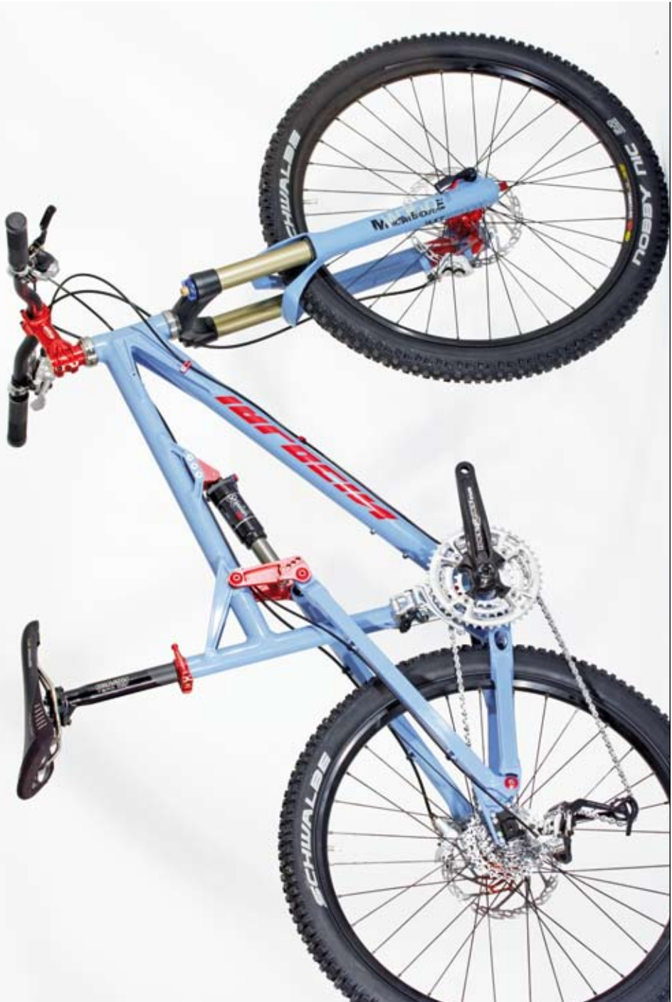
Helius AM photo bike: 14,2 kg