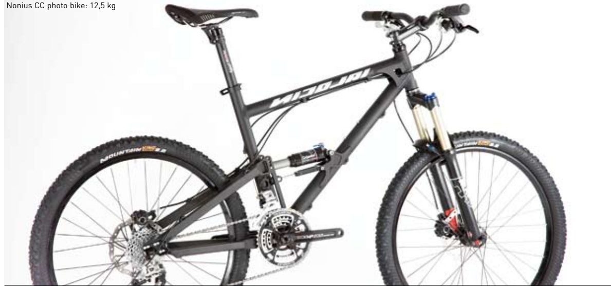
Nonius CC photo bike: 12,5 kg