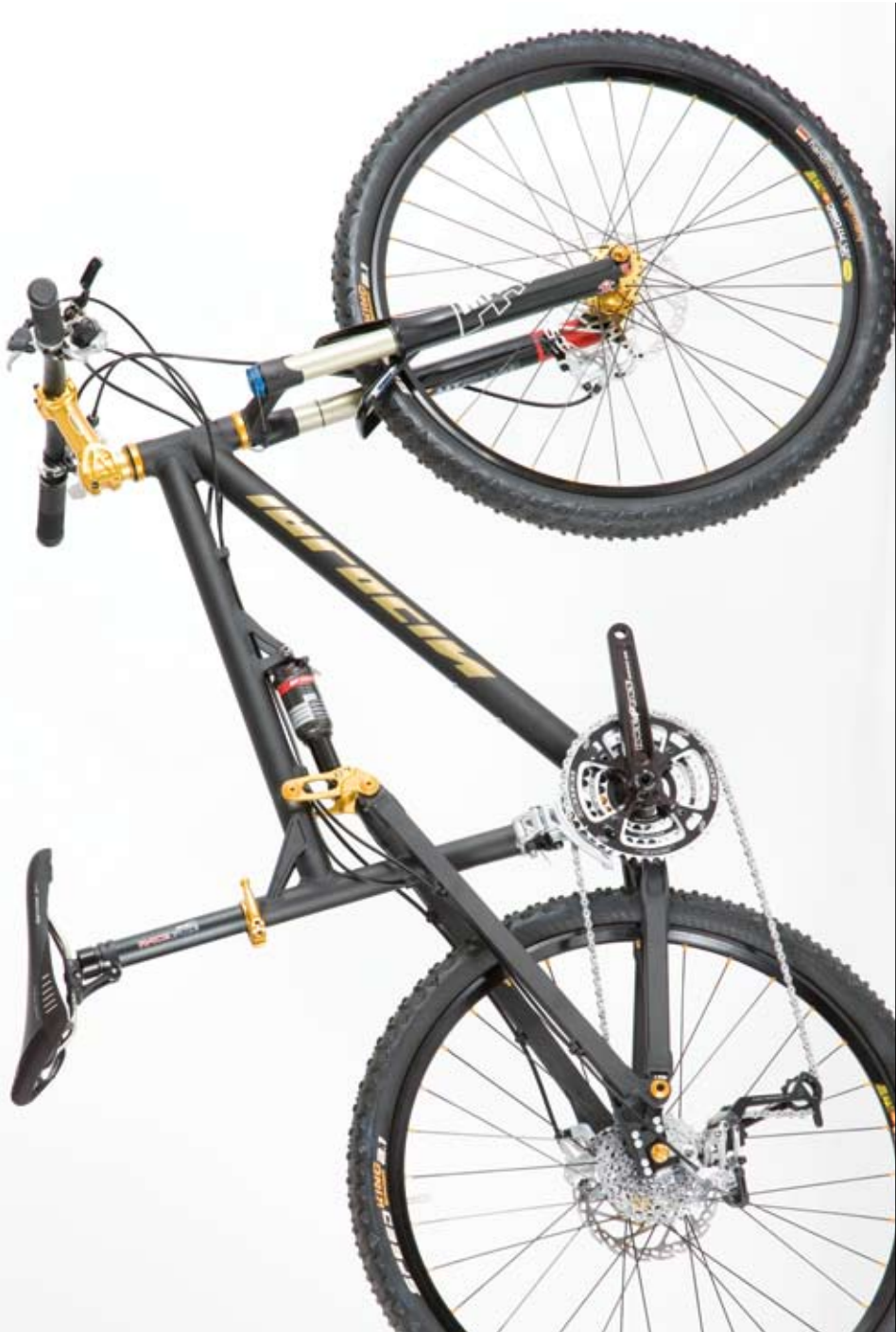
Helius RC photo bike: 10,7 kg