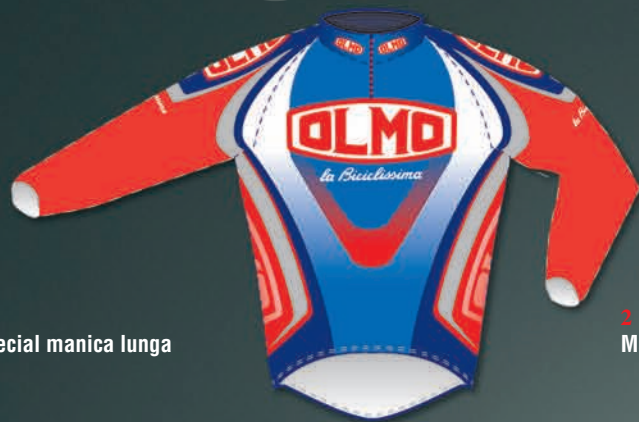
1 Maglia special manica lunga