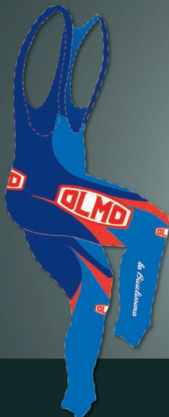
4 Calz maglia thermodress