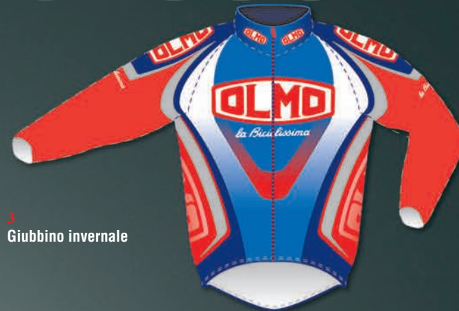
3 Giubbino invernale