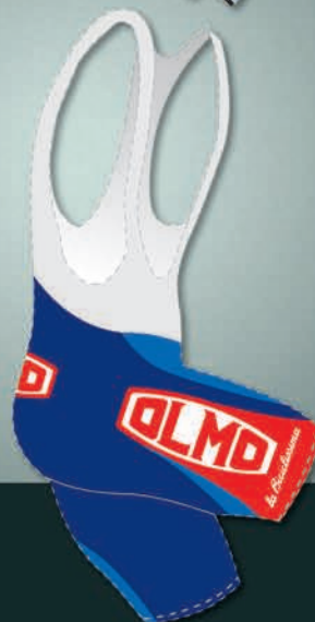
7 Calzoncini con bretella