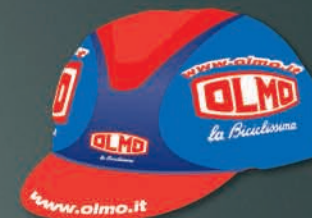
6 Berretto Estivo