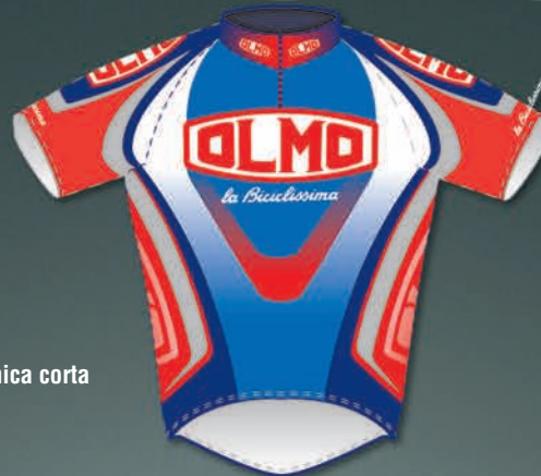
2 Maglia manica corta