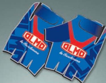
5 Guanti Estivi