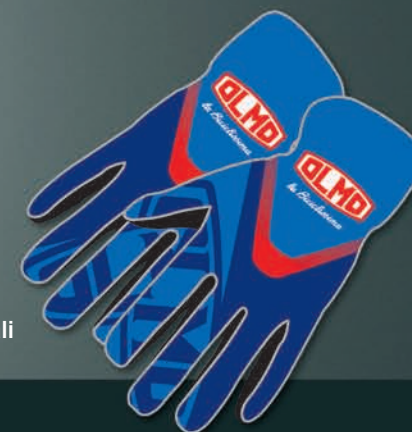
8 Guanti invernali in neoprene