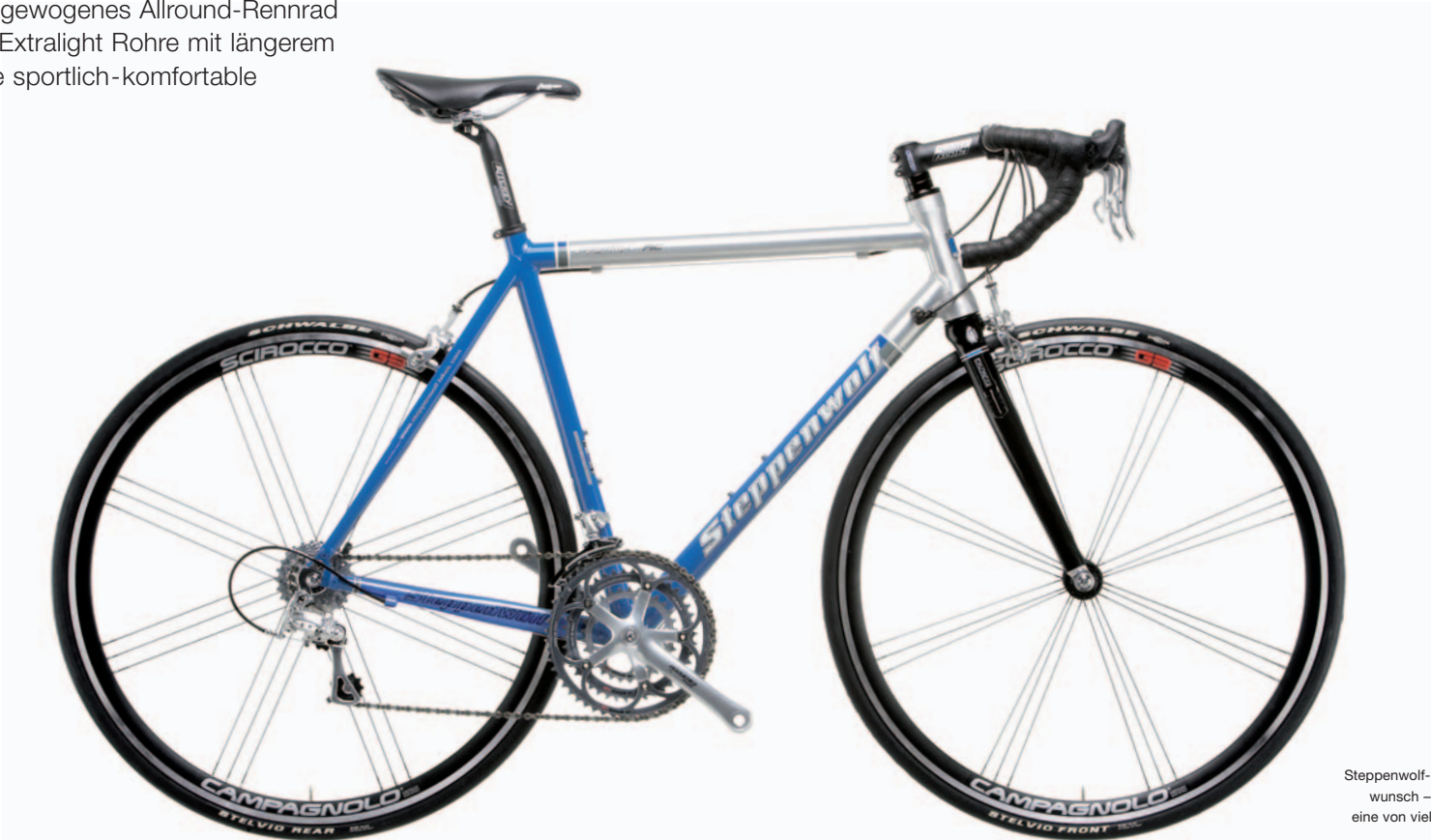
Steppenwolf-Bikes entstehen nach Kundenwunsch – das abgebildete Rad zeigt nur eine von vielen möglichen Modellvarianten.

EINSATZ: Tour, Race CHARAKTER: ausgewogenes Allround-Rennrad BESONDERHEIT: Extralight Rohre mit längerem Steuerrohr für eine sportlich-komfortable Sitzposition