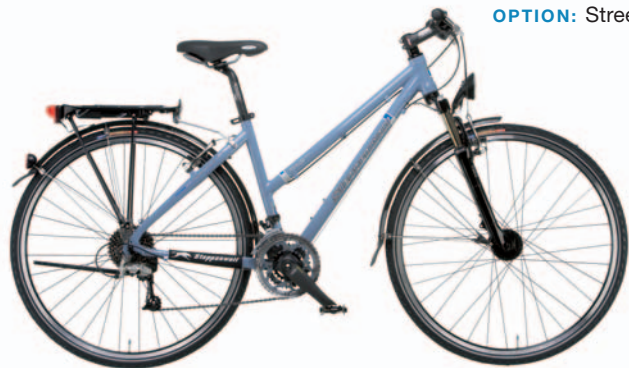
OPTION: Street Kit