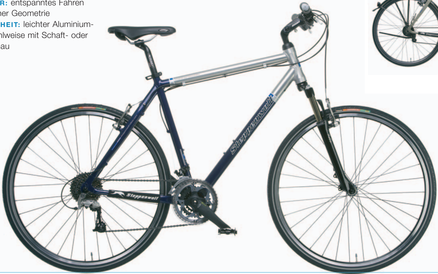
OPTION: Street Kit

BESONDERHEIT: leichter Aluminiumrahmen wahlweise mit Schaft- oder Ahead-Vorbau