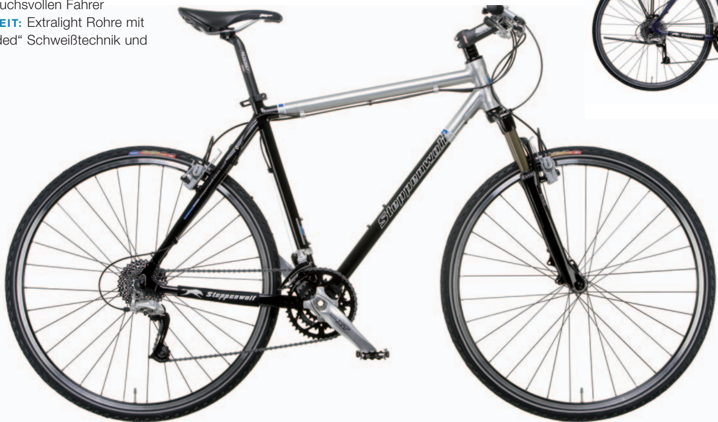
OPTION: Street Kit

BESONDERHEIT: Extralight Rohre mit „smooth-welded“ Schweißtechnik und edler Optik