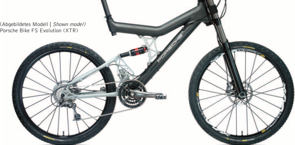
(Abgebildetes Modell | Shown model ) Porsche Bike FS Evolution (XTR)

Vollgefederte Carbontechnologie für jedes Terrain. Superleichtes, sportorientiertes, vollgefedertes Marathon-, Enduro- und Freeride-Bike aus Carbon mit verstellbarem Federweg, sowie sperrbarer Hinterbaufederung.