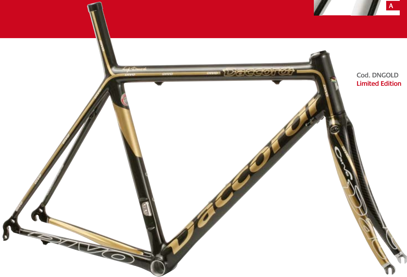
Cod. DNGOLD Limited Edition